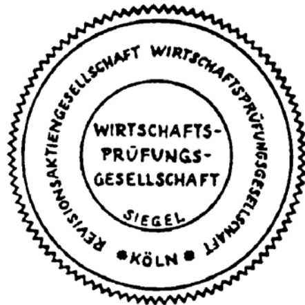
Siegel einer Wirtschaftsprüfungsgesellschaft