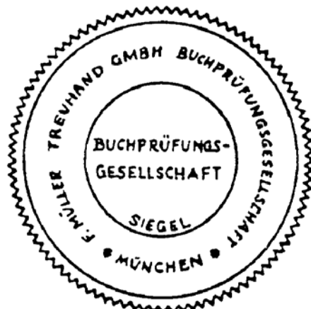
Siegel einer Buchprüfungsgesellschaft