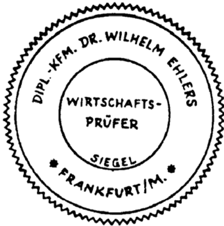
Siegel eines Wirtschaftsprüfers